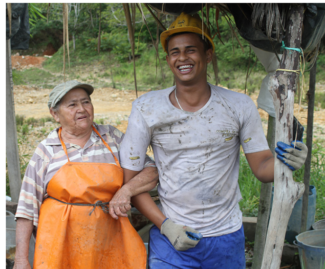
Mineros artesanales en la region de Segovia buscan maneras para mejorar la recuperacion de oro sin el uso de mercurio.