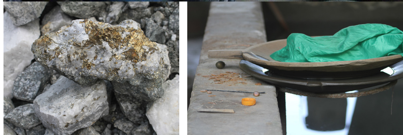
Mineros artesanales en Segovia usan cocos para la amalgamación de mineral en bruto.