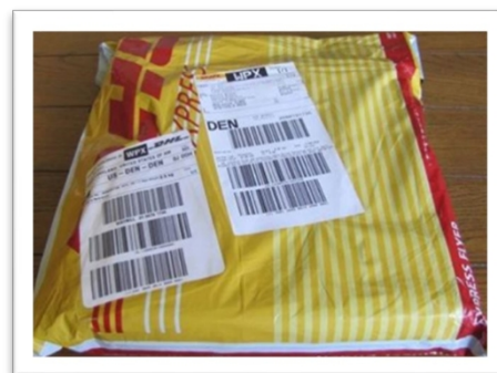
Figure 1 : Exemple d'enveloppe matelassée d'un service de messagerie utilisée pour expédier des échantillons.

Une fois l'expédition traitée, veuillez en informer le représentant du BRI ou tout autre membre du personnel du laboratoire, selon le cas, par e-mail.